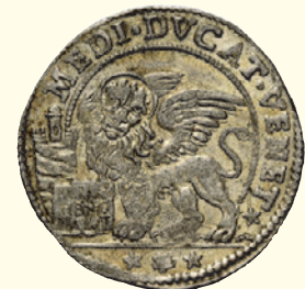
921 Mezzo ducato, AR 11,33 g. S M V M FRAN MAVROC D S. Marco nimbato, seduto a s. e benedicente, consegna il vessillo al doge genuflesso; all'ersergo, A G (Alvise Gritti massaro). Rv. MEDI DVCAT VENET Leone alato e nimbato gradiente, volto di fronte, con la zampa anteriore d. appoggiata sul libro aperto. CNI 25. Paolucci 13. Usuale debolezza di conio al dr. Esemplare con bei fondi lucenti, q.Fdc 921 600