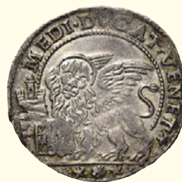
922 Mezzo ducato, AR 11,25 g. S M V M FRAN MAVROC D S. Marco nimbato, seduto a s. e benedicente, consegna il vessillo al doge genuflesso; all'ersergo, P P (Paolo Pisani massaro). Rv. MEDI DVCAT VENET Leone alato e nimbato gradiente, volto di fronte, con la zampa anteriore d. appoggiata sul libro aperto. CNI 49. Paolucci 13. Colpetto sul bordo del rv., altrimenti q.Spl 922 250