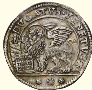
920 Ducato, AR 22,51 g. S M V M FRAN MAVROC D S. Marco nimbato, seduto a s. e benedicente, consegna il vessillo al doge genuflesso; all'ersergo, M B (Mattio Balbi massaro). Rv. DVCATVS VENETVS Leone alato e nimbato gradiente, volto di fronte, con la zampa anteriore d. appoggiata sul libro aperto. CNI 75. Paolucci 12. 920 Spl 500