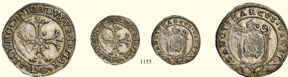
1155 Ottavo di scudo della croce, AR 3,95 g. ALOY MOCENICO DVX VENETIAR Croce ornata e fogliata, accantonata da quattro foglie di vite. All'ersergo, D G (Domenego Gritti massaro). Rv. SANCTVS MARCVS VENET Leone in soldo, entro scudo ornato; all'ersergo, 17 1/2. CNI 20. Paolucci 22. Molto raro. Consuete tracce di ribattitura, altrimenti q.Fdc 500