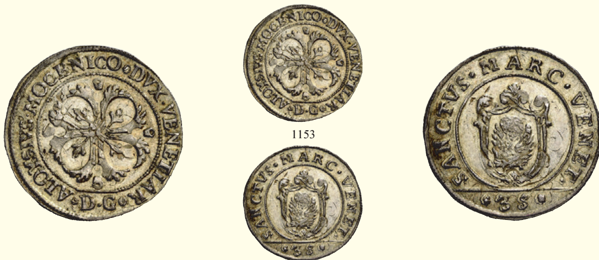
1153 Quarto di scudo della croce, AR 7,41 g. ALOYSIVS MOCENICO DVX VENETIAR Croce ornata e fogliata, accantonata da quattro foglie di vite. All'ersergo, D G (Domenego Gritti massaro). Rv. SANCTVS MARC VENET Leone in soldo, entro scudo ornato; all'ersergo, 35. CNI 17. Paolucci 21. Raro. Fondi brillanti, q.Fdc 800