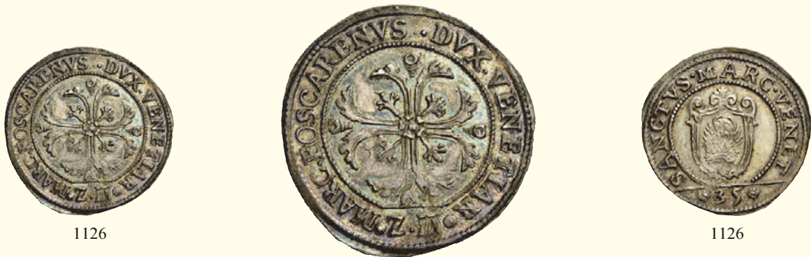
1126 Quarto di scudo della croce, AR 7,24 g. MARC FOSCARENVS DVX VENETIAR Croce ornata e fogliata, accantonata da quattro foglie di vite. All'esergo, Z D (Zuanne Dolfin massaro). Rv. SANCTVS MARCVS VENET Leone in soldo, entro scudo ornato; all'esergo, 35. CNI 11. Paolucci 9.

Molto raro. Patina di medagliere su fondi lucenti, q.Fdc