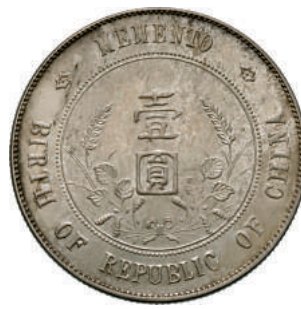
82 Dollaro (1927) Sun Yat Sen "memento" L&M 49 Kann 608 Ag g 26,87 SPL/FDC 100