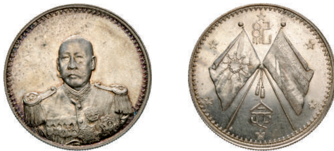
80 Dollaro (1923) Tsao Kun. L&M 959 Kann 678 Ag g 26,59 • Ex Asta Varesi 13 del 1991, lotto 1108 SPL 4.500