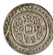
122 TIBET Qian Long (1736-1795) 1 Sho A. 58 (1793) Kr. C52 Ag g 3,66