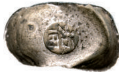
51 1 Tael "a sella" Ag g 35,75 100