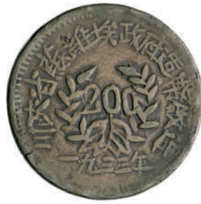
55 200 Cash 1933. Kr. Y510 Ae g 27,20