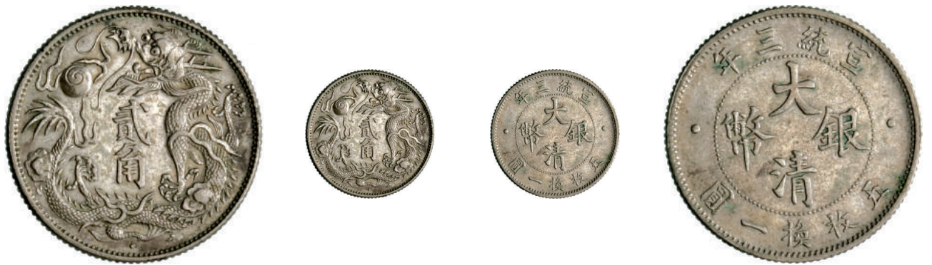
70 20 Cent A. 3 (1911) L&M 40 Kann 229 Ag g 5,38 q.SPL 1.000