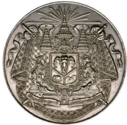
120 TAILANDIA Rama V (1876-1902) Medaglia (1873) per l'incoronazione. Thai Treasury Catalogue p. 33 Ag mm 65,54 g 121,20