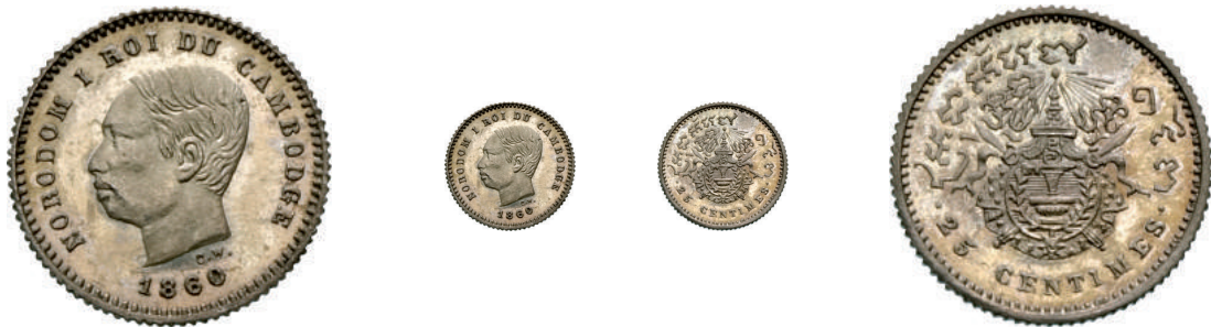
4 CAMBOGIA Norodom I (1860-1904) 25 Cent 1860. Kr. 44 Ag g 1,40 • Rarissima variante con iniziali dell'incisore OW al posto di CW FDC/proof 1.000