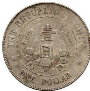
72 CINA Repubblica (1912-1949) Dollaro (1912) Li Yuan Hung L&M 45 Kann 639 Ag g 27,02