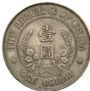
73 Dollaro (1912) Li Yuan Hung. L&M 43 Kann 630 Ag g 26,73