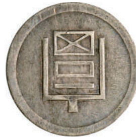
63 1/2 Tael s.d. (1943-1944) L&M 434 Kann 941 Ag g 18,90 SPL 300