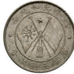
64 50 Cent (1917) Kr. Y479.1 Ag g 13,41 SPL 120