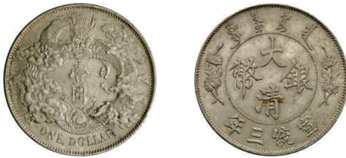
68 CINA Emissioni generali Pu Yi (1908-1917) Dollaro A. 3 (1911) L&M 36 Kr. 227a Ag g 26,79 SPL 700