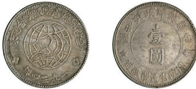
52 CINA Szechuan Shensi Repubblica Sovietica (1931-1934) Dollaro (1934) L&M 891 Kr. Y513.1 Ag g 24,07 BB 2.000