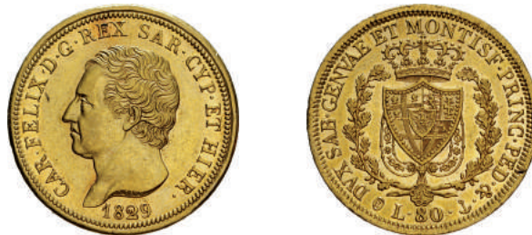
347. Carlo Felice, 1821-1831. Da 80 lire 1829 Genova. Pagani 33. MIR 1032l. q.Spl / Spl 2.000 Ex asta NAC 60, 2011, 320.