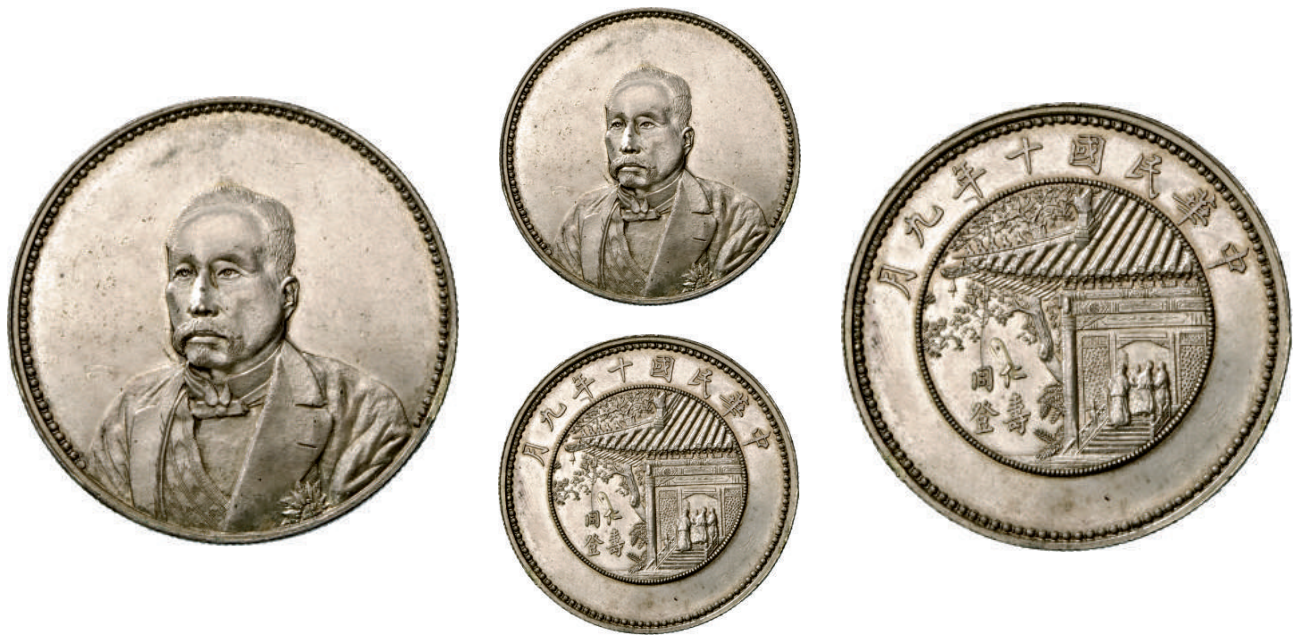
77 Dollaro (1921) Hsu Shih Chang, "pattern" (prova) L&M 957 Kann 676a Ag g 27,00 • ex Asta Varesi 5 del 1986, lotto 1004 SPL/FDC 8.000