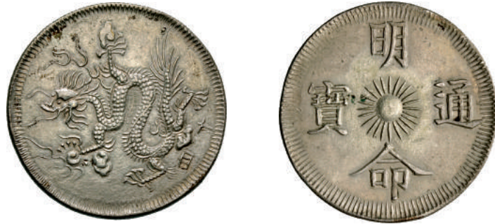
1 ANNAM Minh Mang (1820-1841) 7 Tien A. 14 (1833) Kr. 195 Ag g 26,42 SPL 700