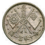
91 10 Cent A. 16 (1927) Sun Yat Sen. L&M 849 Kann 607 Ag g 2,51