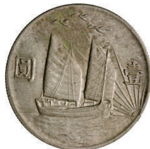
85 Dollaro A. 21 (1932) Sun Yat Sen. L&M 108 Kr. Y344 Ag g 26,70 SPL+ 2.000