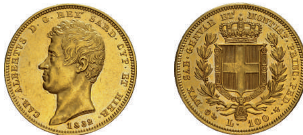
348 Carlo Alberto, 1831-1849. Da 100 lire 1832 Genova. Pagani 134. MIR 1043a. Fondi lucenti, Spl 3.500