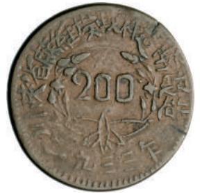
56 200 Cash 1933. Kr. Y510.3 Ae g 27,20