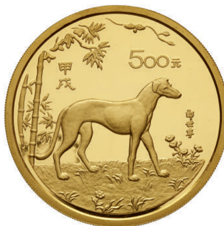
93. 500 Yuan 1994 tipo levriero. Kr. 649 Au • Solo 99 es. conati, questo è l'86°