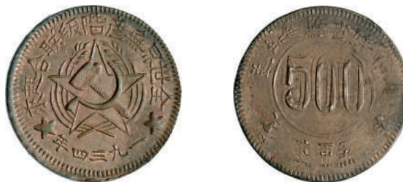
53 500 Cash (1934) Kr. 512.1 Ae g 12,17 • Tracce di rosso SPL 1.500