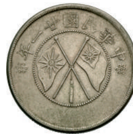
65 50 Cent (1932) Kr. Y492 Ag g 13,31 BB+ 20