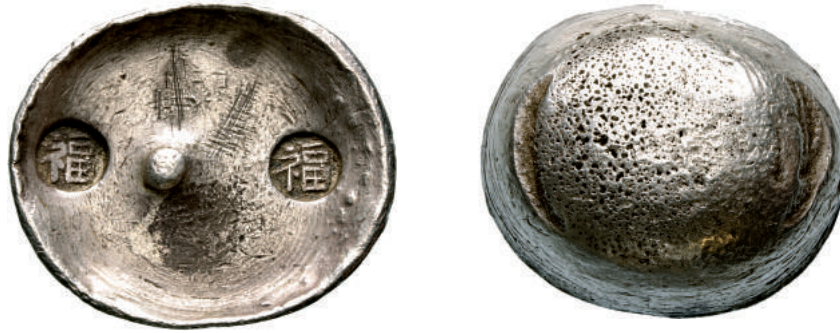
50 CINA Szechuan Piaoding Dinastia Qing (1636-1912) 5 Tael. Ag g 181,96 300