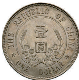
74 Dollaro (1912) Sun Yat Sen. L&M 42 Kr. Y319 Ag g 26,83 • Ex Asta Varesi 13 del 1991, lotto 1099