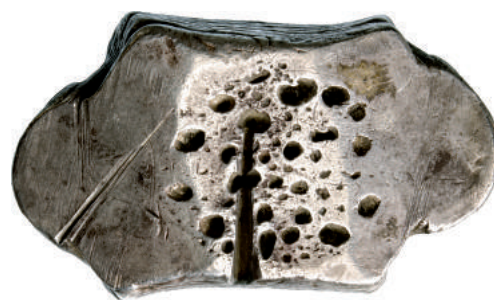
67 CINA Yunnan Sanchuo Jieding Dinastia Qing (1636-1912) 5 Tael "a sella" Ag g 185,24 500