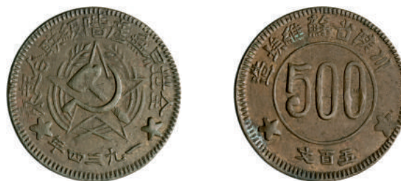
54 500 Cash (1934) Kr. 512.1 Ae g 13,20 BB 350