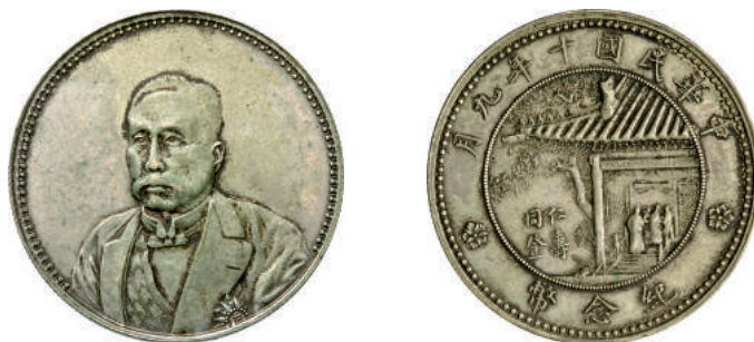
78 Dollaro (1921) Hsu Shih Chang. L&M 864 Kann 676 Ag g 26,83 q.SPL 3.500