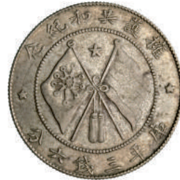
66 50 Cent s.d., Tang. L&M 862 Kann 674 Ag g 13,39 BB+ 1.000