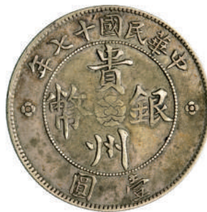
83 Dollaro A 17 (1928) Kweichow. L&M 609 Kann 757 Ag g 26,36 BB 3.500