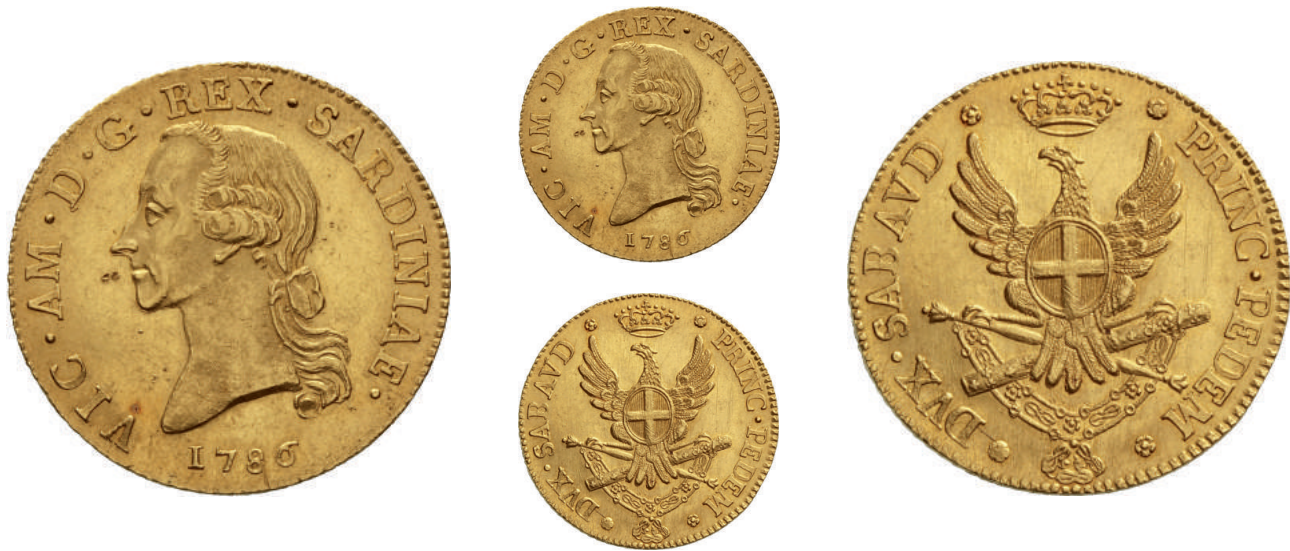
346 Mezzo Carlino da 2,5 Doppie 1786, Torino, AV 22,78 g MIR 980. Simonetti 2/1 Molto rara. Di grande qualità. q.Fdc 15.000