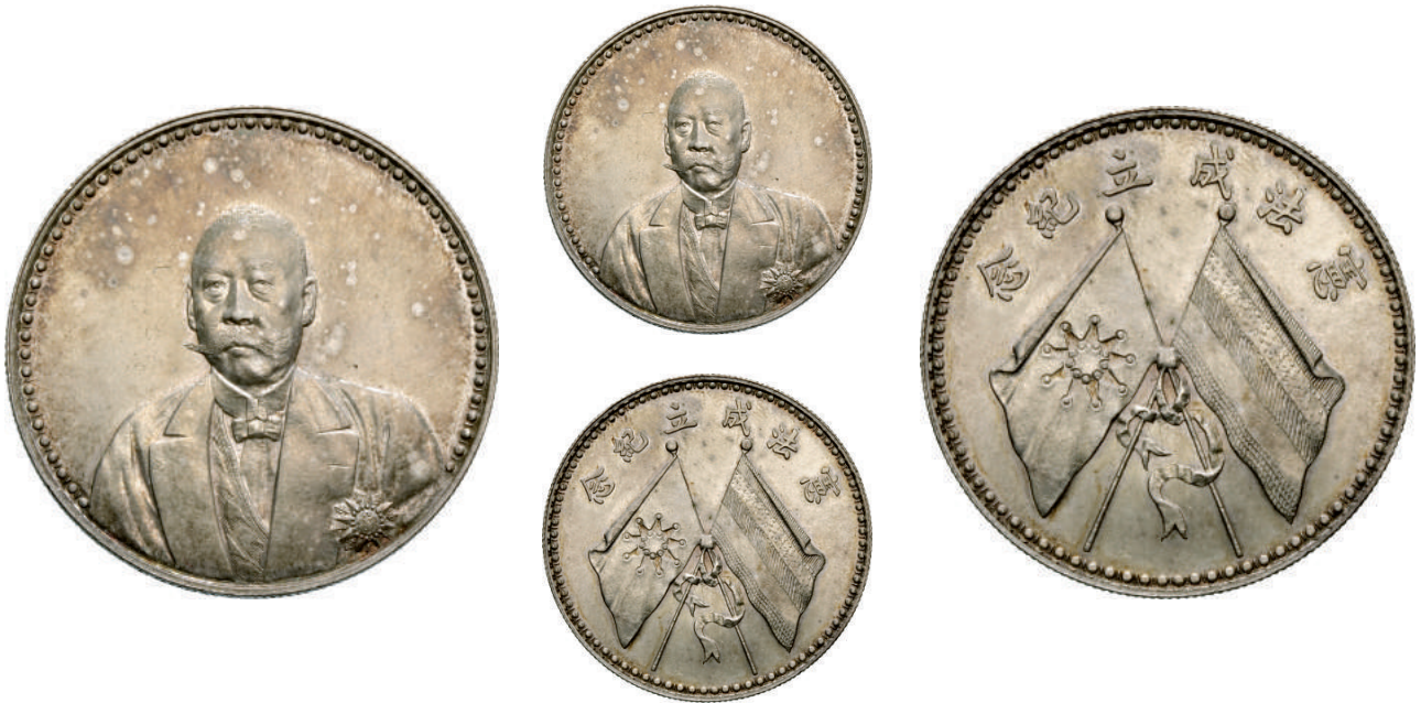
79 Dollaro (1923) Tsao Kun. L&M 958 Kann 677 Ag g 26,77 • Ex Asta Varesi 13 del 1991, lotto 1107 SPL 5.000