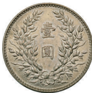
84 Dollaro A. 12 (1923) L&M 80 Kann 680 Ag g 26,92 SPL 5.000