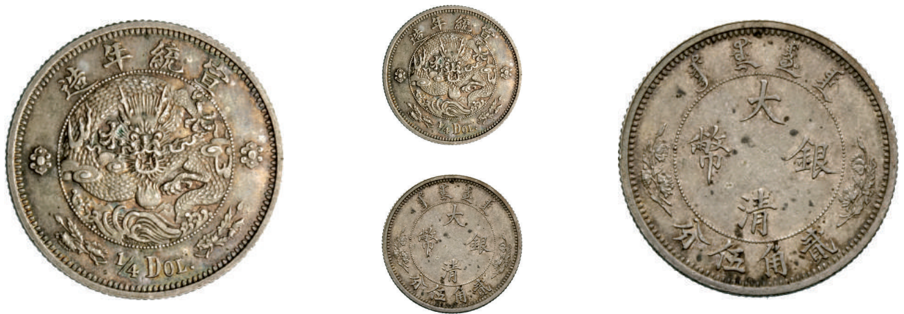
69 1/4 Dollaro (1910) L&M 26 Kr. 221 Ag g 6,92 • Bella patina SPL/FDC 6.000