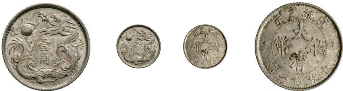
71 10 Cent (1911) L&M 41 Kr. Y28 Ag g 2,67 SPL/FDC 1.000