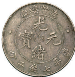
58 CINA Tai Ching Ti Kuo Kuang-hsu (1875-1908) Dollaro (1908) L&M 11 Dav. 214 Ag g 26,78