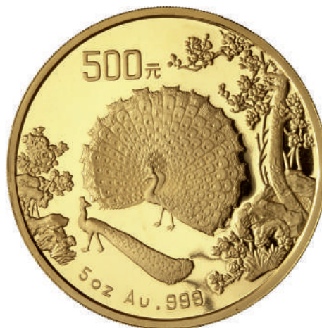
92 CINA Repubblica Popolare (dal 1949) 500 Yuan 1993 tipo pavone. Kr. 600 Au • Solo 99 esemplari conati, questo è il 28°