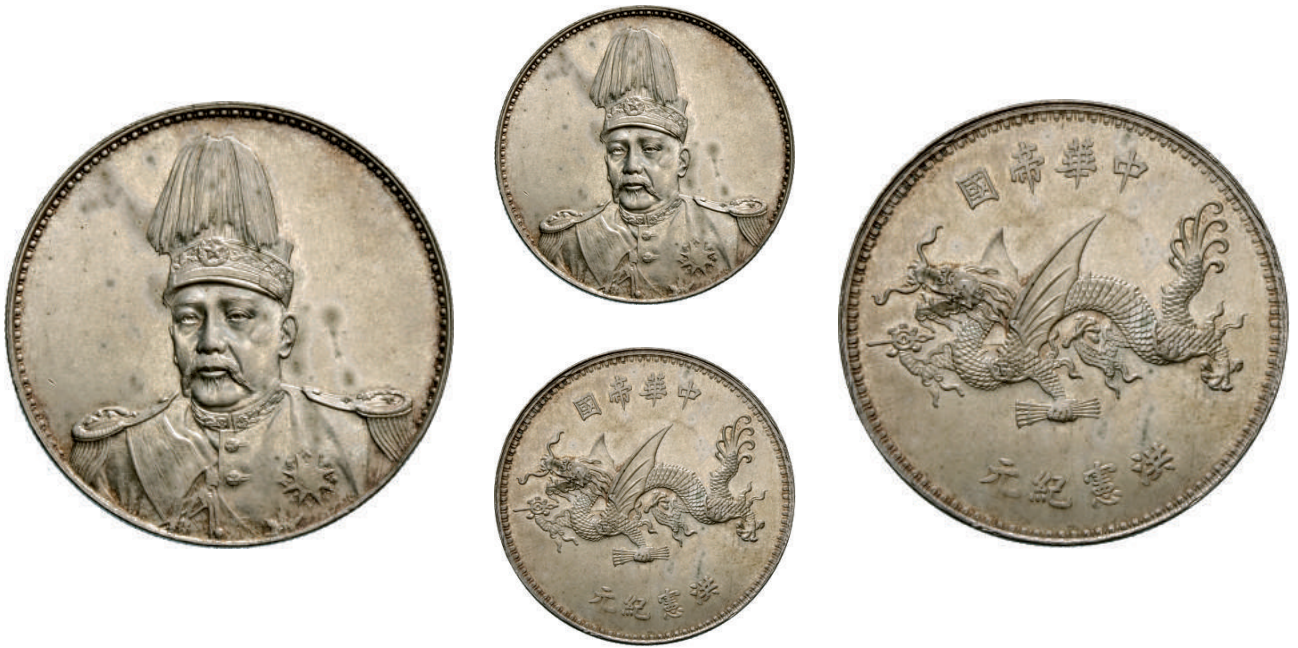
76 Dollaro (1916) Yuan Shih-kai L&M 942 Kann 663 Ag g 26,91 q.FDC 7.500