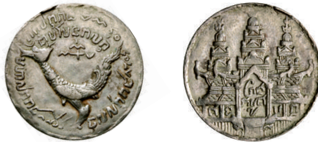
3 CAMBOGIA Ang Duong (1841-1860) 1 Tical CS1208 (1847) Kr. 37 Ag g 15,38 BB 150