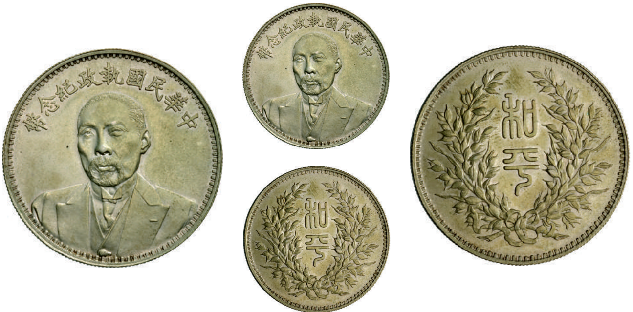
81 Dollaro (1924) Tuan Chi Jui. L&M 865 Kann 683 Ag g 26,90 SPL/FDC 5.000